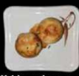
Yaki mushroom Gebakken champignons