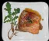
Sake teryaki Gegrilde zalm