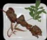
Lamsspies met zwarte pepers