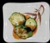
Yasai mori Gebakken courgette