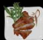
Botaniku furai Varkenshaas met tonkatsusaus