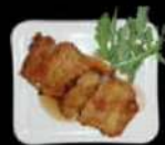
Pangasiusfilet met tonkatsusaus