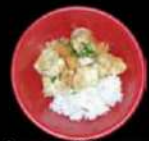
Japanse kip curry rijst