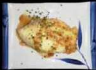
Tori teryaki cheese