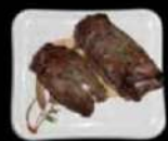
Gyu maki Biefrolletjes