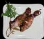
Ika kushi Gegrilde inktvis