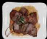
Gyu yaki Rundfilet pur