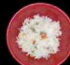
Yaki Meshi Gebakken rijst