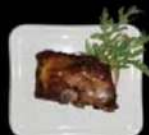
Gyuniku Gegrilde spare-ribs