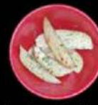
Aardappelen in de oven